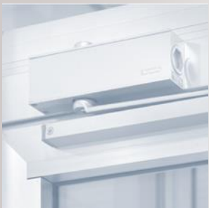
Ferme porte haut