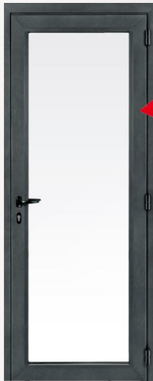
Porte Traffic classe VIII (1 000 000 de cycles) Esthétique contemporaine Dormant et ouvrant alignés

Porte avec paumelles en applique 120 kgs