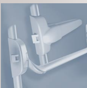
Barres anti panique